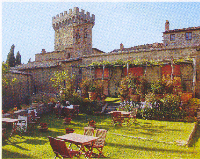
Gargonza: Ferienwohnungen schmiegen sich an Burg und Stadtmauer

Zehn Adressen für Urlaub auf dem Landgut – sowie die besten Ferienhausanbieter