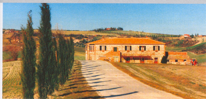
Ruhig und friedlich: Gutshof Il Rigo mitten im Hügelmeeer bei San Quirico d'Orcia

2 Zi.: Ap. 65–155 €/Tag, DZ 55 bis 75 €/Tag, inkl. Frühst. (E 5) www.lapieveagriturismo.it