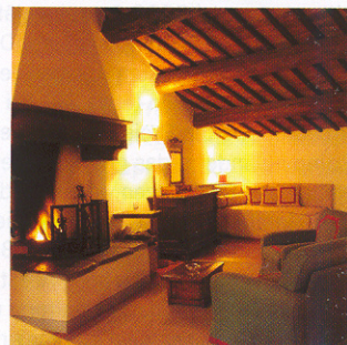
Stilvoll und gemütlich: Castello di Gargonza bei M. San Savino

Gargonza ist eine mittelalterliche Burg wie aus dem Märchenbuch. Sie liegt aussichtsreich auf einem Berg, dominiert vom zinnenbesetzten Wehrturm, unter dem sich alte Steinhäuser Schutz suchend aneinander drängen. Mit Kopfstein gepflasterte Gassen, kleine Ge-