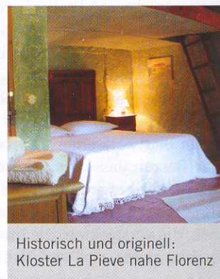
Historisch und originell: Kloster La Pieve nahe Florenz