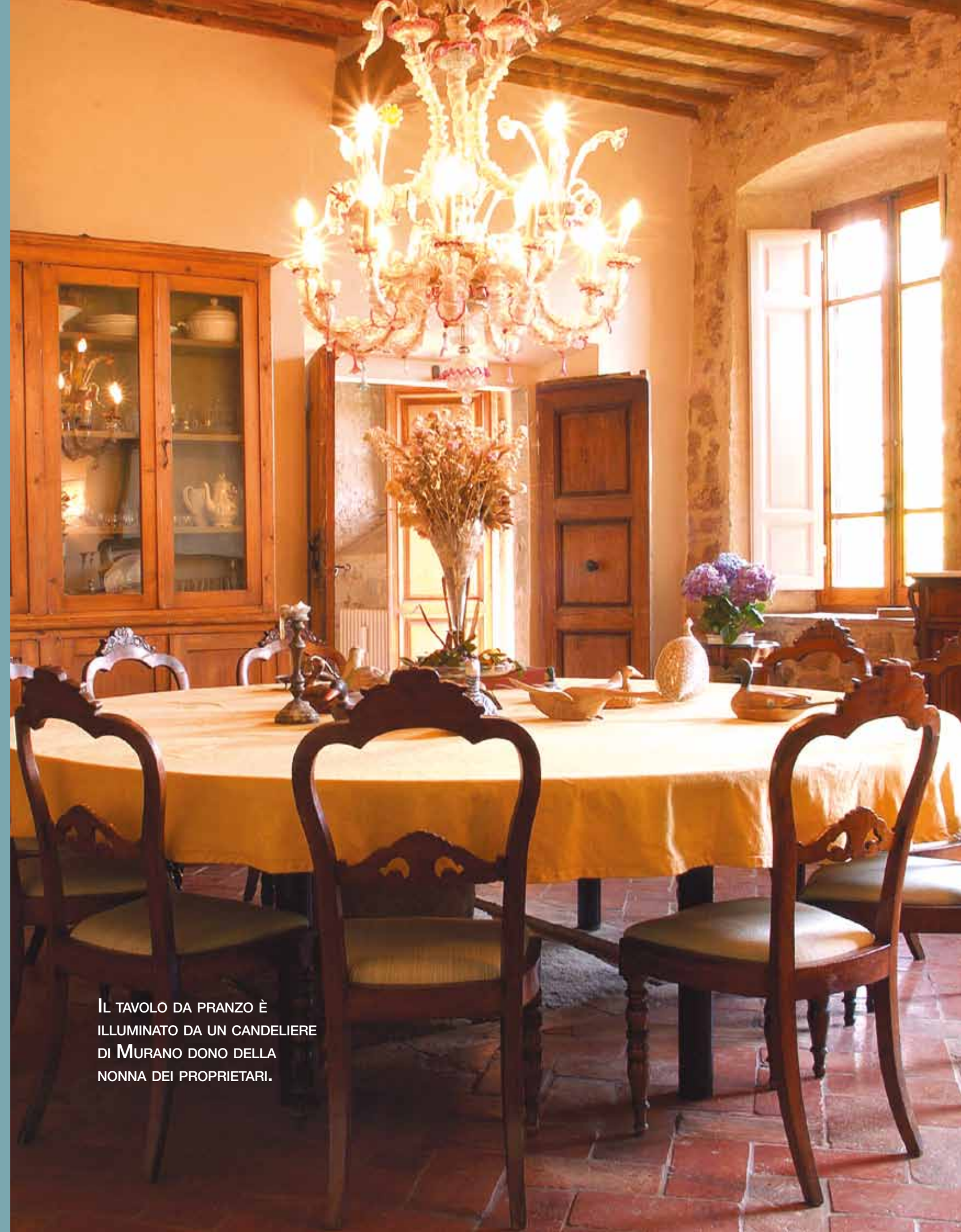
IL TAVOLO DA PRANZO È ILLUMINATO DA UN CANDELIERE DI MURANO DONO DELLA NONNA DEI PROPRIETARI.